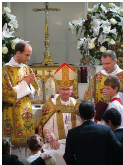
Confirmations par Mgr Morerod le 5 mai 2013

Suivant le nombre d'inscrits et leur répartition géographique, des cours de préparation seront organisés dans l'un ou l'autre de ces apostolats.