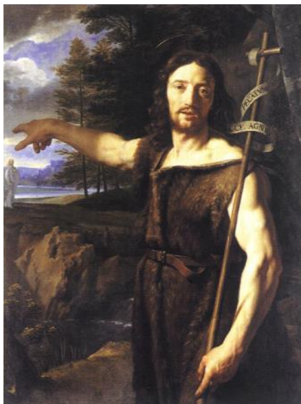
Saint Jean-Baptiste par Philippe de Champaigne

frère Philippe. Mais Jean, au lieu d'agir en homme prudent qui se range aux avis des gens du monde, était résolu à plaire à Dieu et non aux hommes. Aussi, comme le rapporte l'Évangile, il décida de s'élever contre cette conduite scandaleuse. Il désirait trop le bien pour cacher le péché d'Hérode, il prenait trop à cœur sa santé morale pour laisser une telle