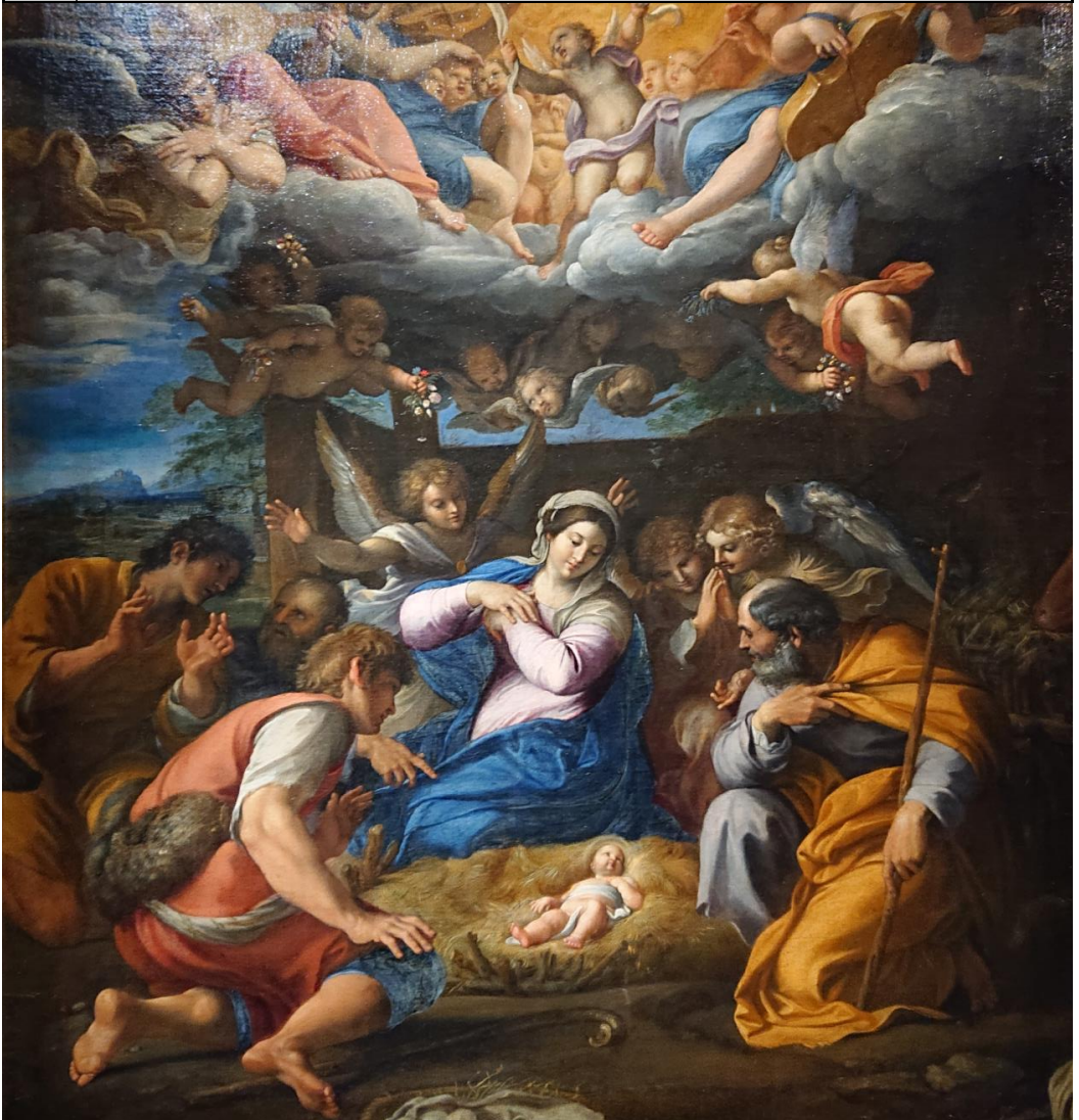
Annibal Carrache, L'adoration des bergers , ca. 1597

Les prêtres de la Fraternité Sacerdotale Saint-Pierre vous présentent leurs meilleurs vœux et vous assurent de leurs prières en ce temps de Noël et à l'occasion de la nouvelle année 2019.