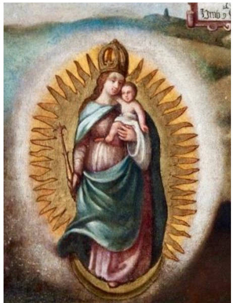
La Vierge Marie apparaissant à la Pentecôte 1531, à Wesemlin, tout près de Lucerne .

Départ en car de Fribourg (place Notre-Dame) à 8h ; retour prévu vers 19h30.