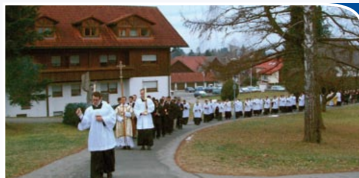
Procession de la Purification de la Sainte Vierge