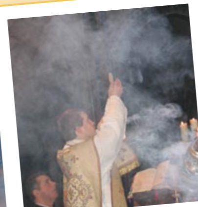
« Mon Seigneur et mon Dieu ».