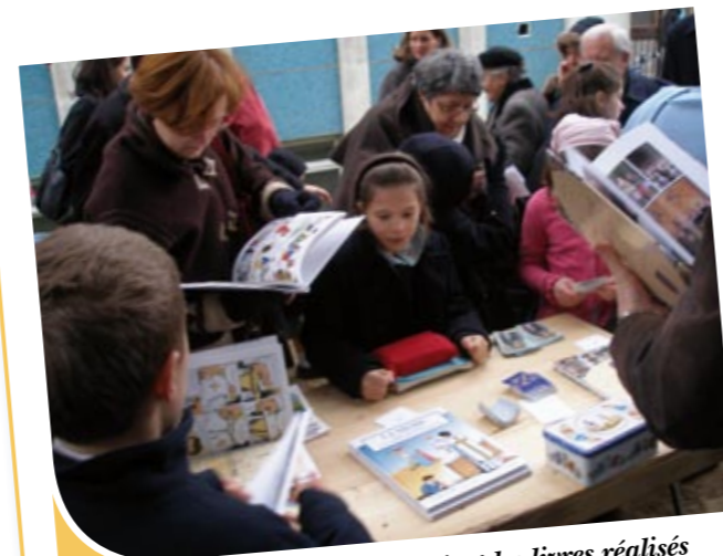
Les fidèles de Nantes apprécient les livres réalisés par la Fraternité.