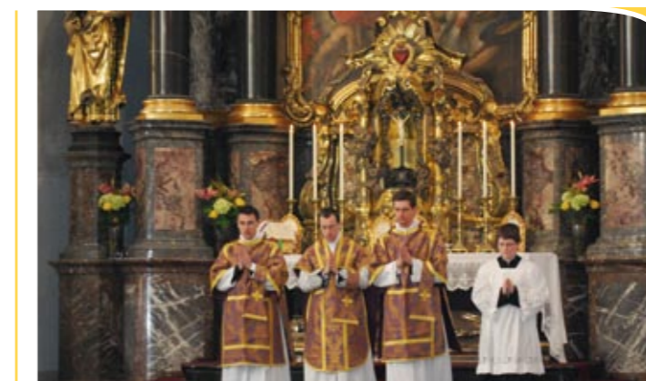
Messe solennelle à l'église Saint-Michel (Fribourg)