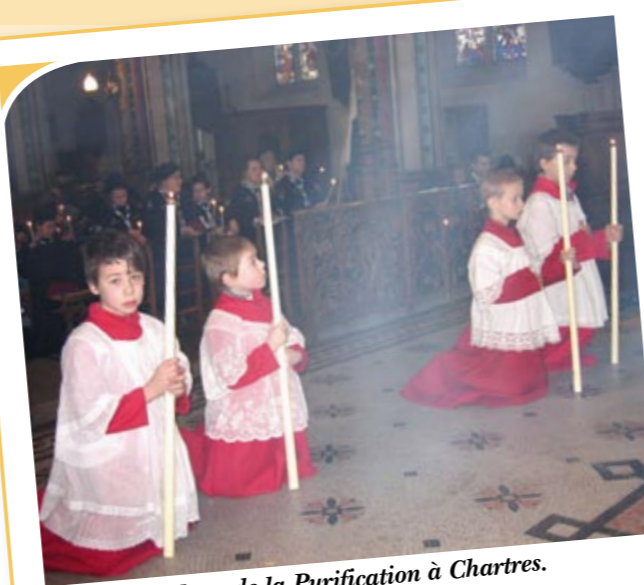
Messe de la Purification à Chartres.