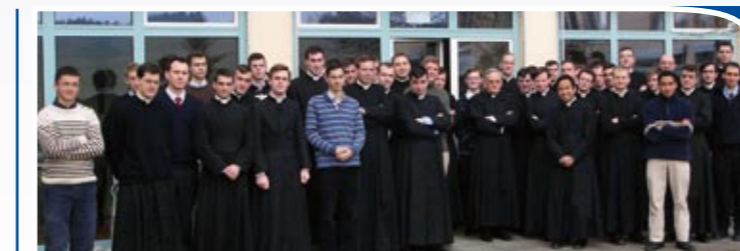
À la fin de la retraite spirituelle