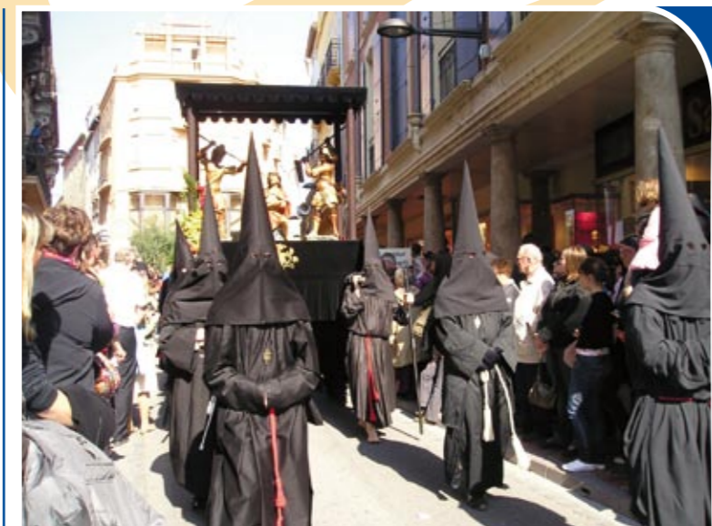
Procession du Vendredi-Saint

Vous pouvez dès maintenant inscrire vos enfants à l'Institut Croix-des-Vents (école pour garçons encadrée et dirigée par la Fraternité Saint-Pierre à Sées dans l'Orne). Cette école (internat et externat) comprend toutes les classes de la Sixième à la Terminale (L et S) ainsi qu'une 3 e DP6 (découverte professionnelle). Le dossier d'inscription est disponible sur le site de l'école www.croixdesvents.com ou par téléphone au 02 33 28 43 80.