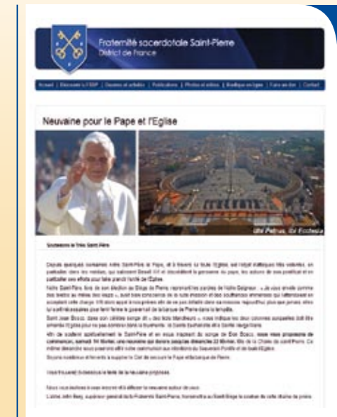
Neuvaine de soutien sur le site internet de la Fraternité.

Depuis la fin du mois de janvier, notre Saint-Père le Pape, et à travers lui toute l'Église, ont fait l'objet d'attaques très violentes, en particulier dans les médias, qui ont sali Benoît XVI et tenté de discréditer la personne du pape, les