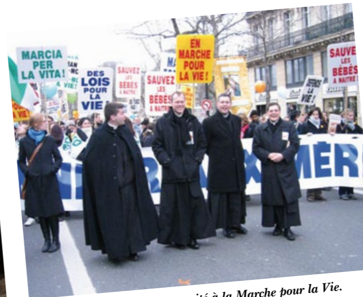
Des prêtres de la Fraternité à la Marche pour la Vie.