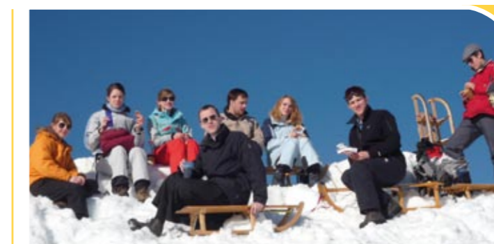
Sortie luge avec un groupe de jeunes

Vu de France, la Suisse semble comparable à un gros département... rien n'est moins vrai ! Chacun des 26 cantons