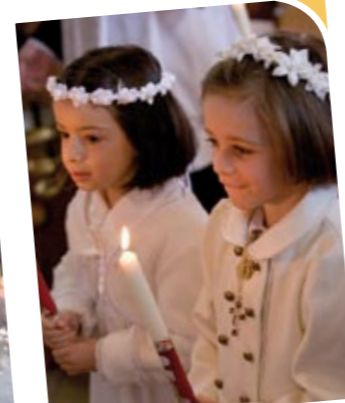
Premières communions (Bulle et Fribourg).